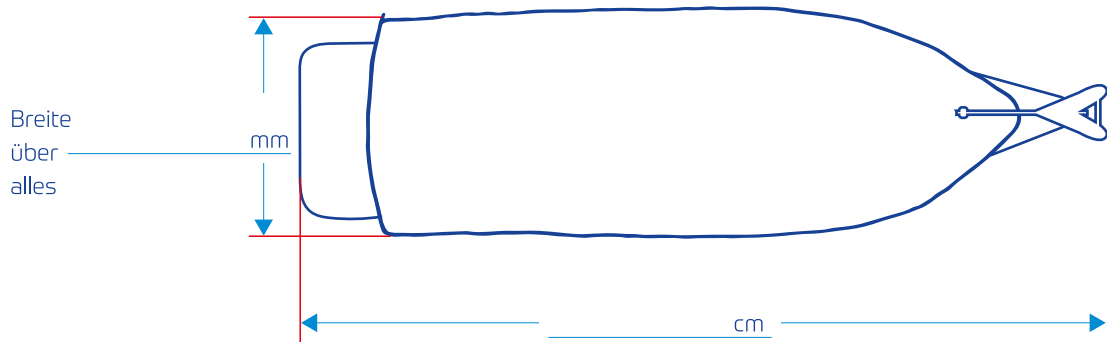
Länge über alles (inkl. Anker, Spinnakerbaum, Bade Steg und sonstigen Anbauten)